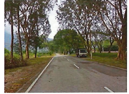
Gambar Semasa Tapak