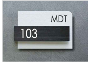
CADANGAN REKABENTUK NO. RUMAH N.T.S