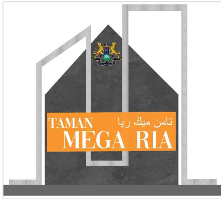
CADANGAN ILUSTRASI REKABENTUK NAMA TAMAN N.T.S